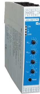
Softstarter VersiStart II 9 PS [9A] CE