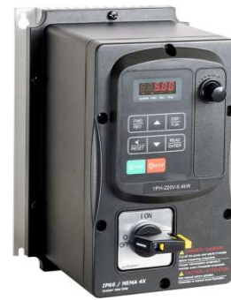
Frequenzumrichter FUS E5/IP66 [0,37 – 2,2kW] FUS 3E5/IP66 [0,75 – 18,5kW]