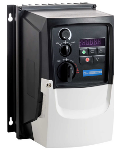
Frequenzumrichter VD i E3/IP66ODS [0,37 – 2,2 kW] VD i 3E3/IP66ODS [0,75 – 22kW]