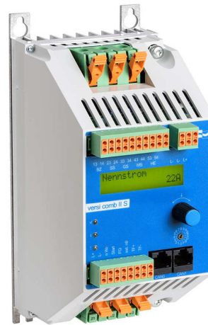
Motorstart-Bremskombination VC II S 480/575 – 12 ... 60