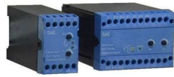
Sanftanlaufgeräte SAS 3 ... 11