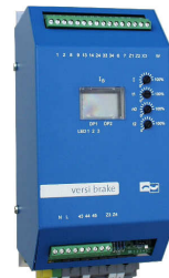
Bremsgeräte VB 230/400-40 ... 600