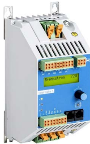
Bremsgeräte VB S 480/600 – 72 ... 360