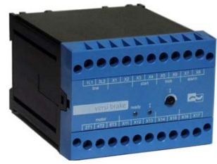
Bremsgeräte VB 230/400-25