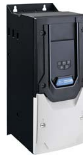
Frequenzumrichter VD i 1100 ... 16000/3Pro/IP55